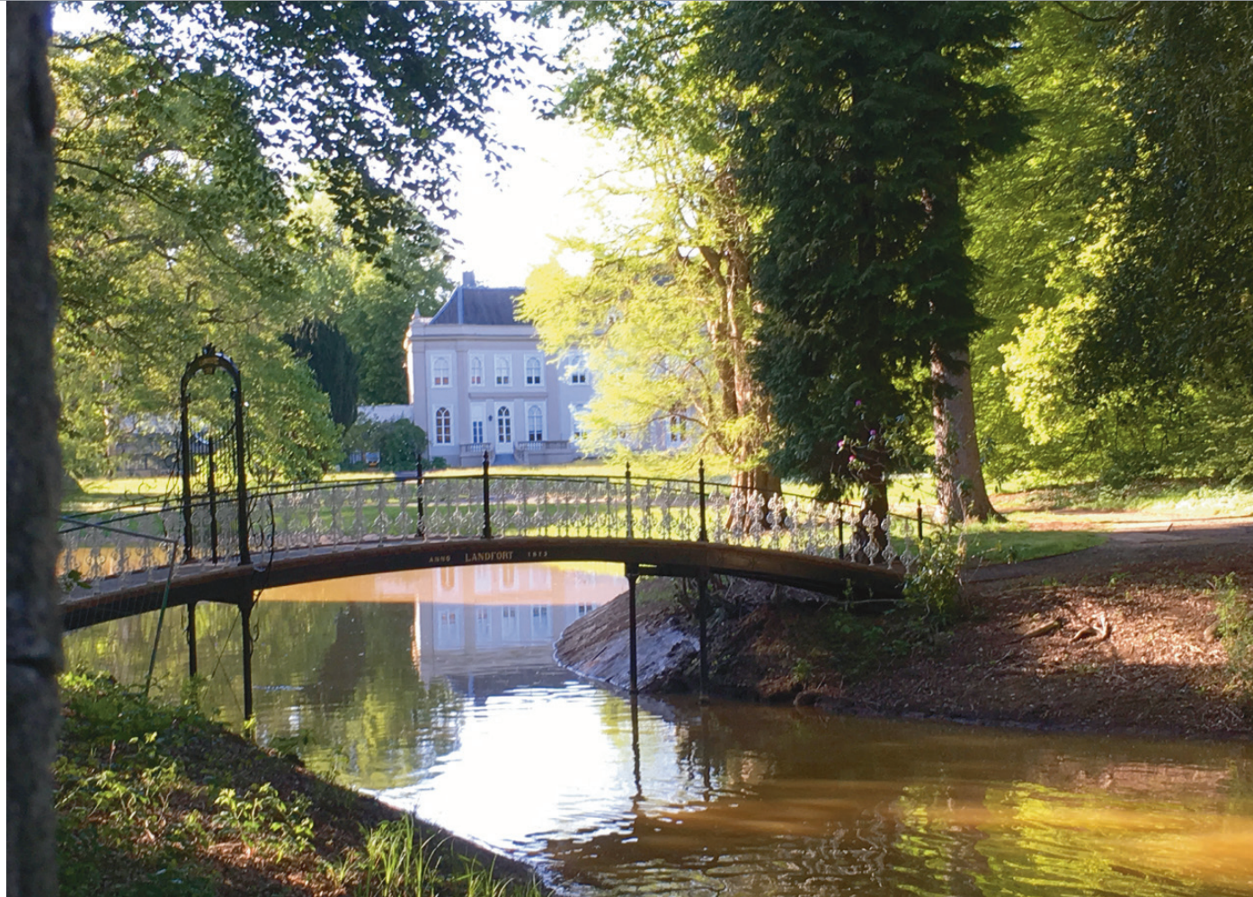
Zicht op de zuidgevel van het huis en brug over de slingergracht

Gelegen aan de Oude IJssel In zijn vormgeving hield Zocher jr. rekening met de Oude IJssel die het terrein begrenst. De gebogen rivierloop komt in het lijnenspel van het park terug. Tegelijk bood de Oude IJssel hem ook een ontwerpstructuur. Zo weerspiegelt de slingerende rivierloop zich in paden en in sommige open ruimten. Daardoor lijkt het net alsof het Kleine Erf, zoals het huiseiland met het landhuis heet, deel uitmaakt van de rivierbedding. Tijdens de jongste renovatie zijn dichtgegroeide zichtlijnen en verdwenen doorzichten naar het hoofdhuis hersteld. Ook karakteristieke landschapselementen zoals houtwallen en heggen zijn hersteld. Deze worden nu gecombineerd met een uitwaaiend padenstelsel dat zich over het Kleine Erf uitstrekt, compleet met bloemperken en kleine bosschages tussen de paden. Dit ontwerp principe was rond 1825 nieuw en staat nu bekend als de vroege gardeneske stijl.